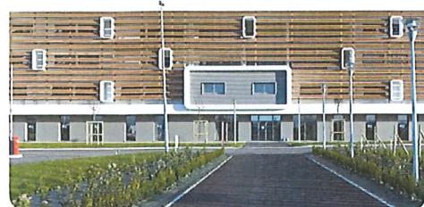
Site de CHATEAUBERNARD