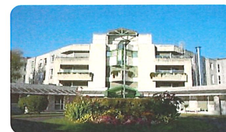
Résidence Montesquieu COGNAC