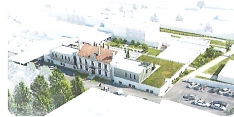
Résidence Médico Social JARNAC