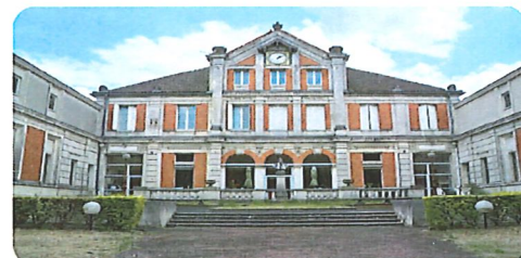
Résidence Guy GAUTIER COGNAC